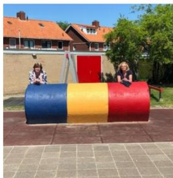
Groep 1-2 a