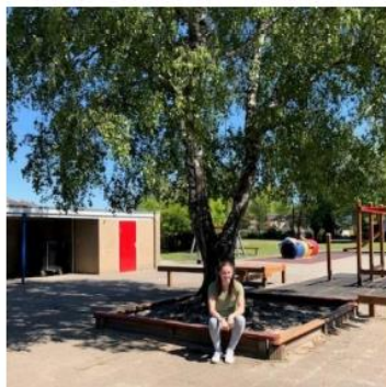
groep 1-2 b